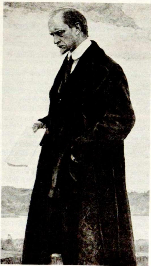
И. А. Ильин (1921–1922) Картина М. В. Нестерова, известная под названием "Мыслитель"

Кризис русской чести и совести. Кризис русского национального характера. Кризис русской семьи. Великий и глубокий кризис всей русской культуры.