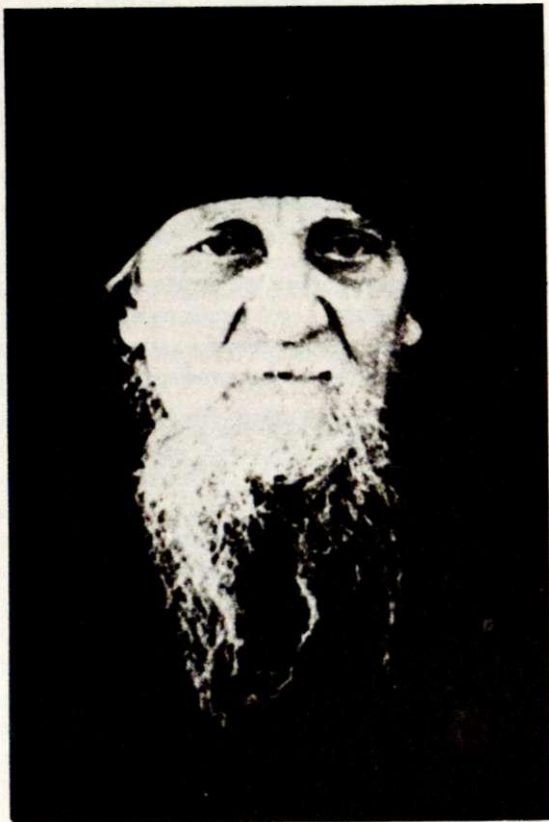
Епископ Афанасий Сахаров