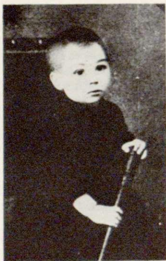
1889 г. Тамбов