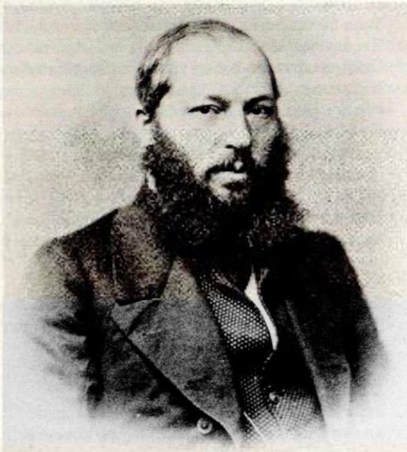
А. А. Шеншинъ (Фетъ)

пор известно было пять стихотворений, адресованных Фетом вел. князю (к которым следует еще прибавить три с двойным адресатом, вел. князю и его жене). "Письмо с золотой короной" Фет уже воспел в 1887 г., но публикуемое нами стихотворение относится по всей вероятности к пятидесятилетнему юбилею литературной деятельности Фета, отмечавшемуся 24 января 1889 г. Обширная переписка Фета и К. Р. до сих пор не опубликована, как и огромное большинство Фетовских писем.