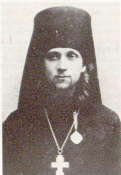
1913. Преподаватель Полтав. Дух. Семинарии