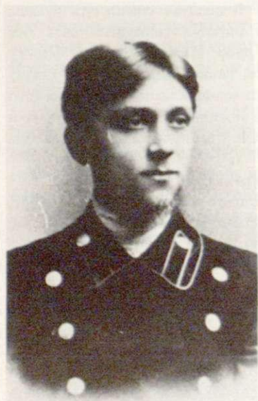
январь 1912. 4-й курс Моск. Дух. Академии