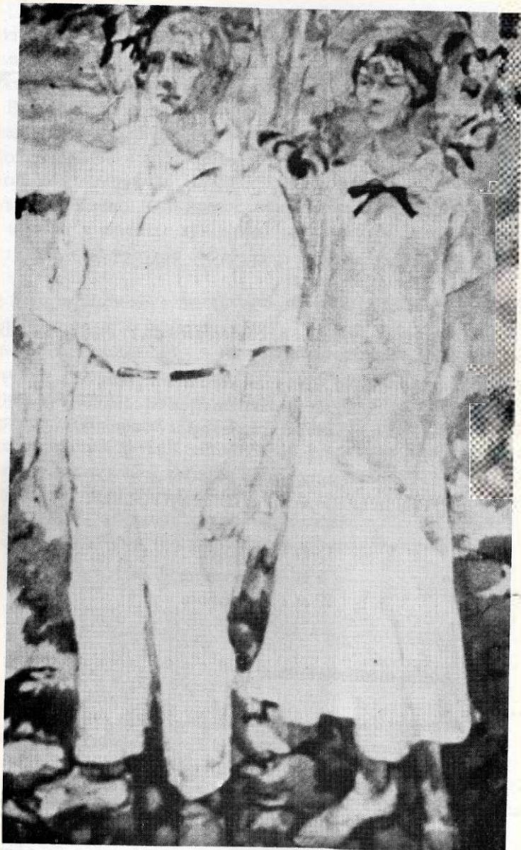
Супруги де Бособр (20-е годы) картина Л. Бруни