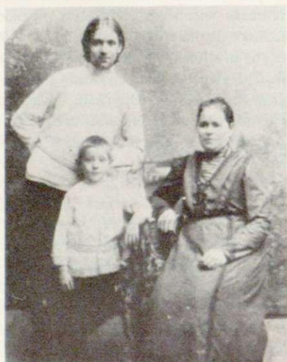
Еп. Афанасий с матерью и братом