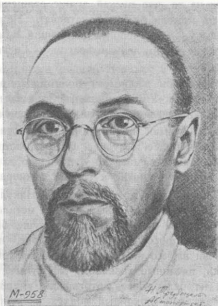
о. Н. Трубецкой (1907—1978)

— Вряд ли вы знаете, что когда «присоединили» Прибалтику к СССР, то экзархом был назначен митрополит Сергей-младший (Воскресенский). Владыка был опытным политиком и когда пришли немцы, перекрасился и благодаря тому был в фаворе. Это позволило создать православную миссию на оккупированных территориях. Я был направлен вместе с другими священниками нашей епархии в составе миссии. Мы открывали и освящали закрытые храмы, проводили массовые крещения. Вам трудно представить, как изголодались люди за годы советизма по Слову Божию. Венчали, отпевали, не хватало времени для сна и еды.