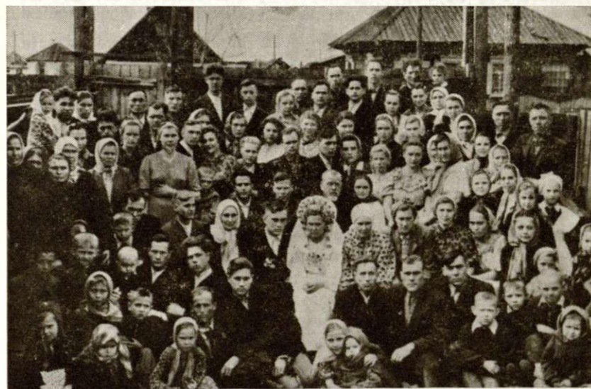
Члены Общины Христиан (Пятидесятники) - гор. Черногорск.

Вопрос: В чем заключаются ограничения вашей религиозной свободы, о которых вы говорите в вашем «Обращении»? Считаете ли вы, что этим ограничениям подвергается только ваше вероисповедание?