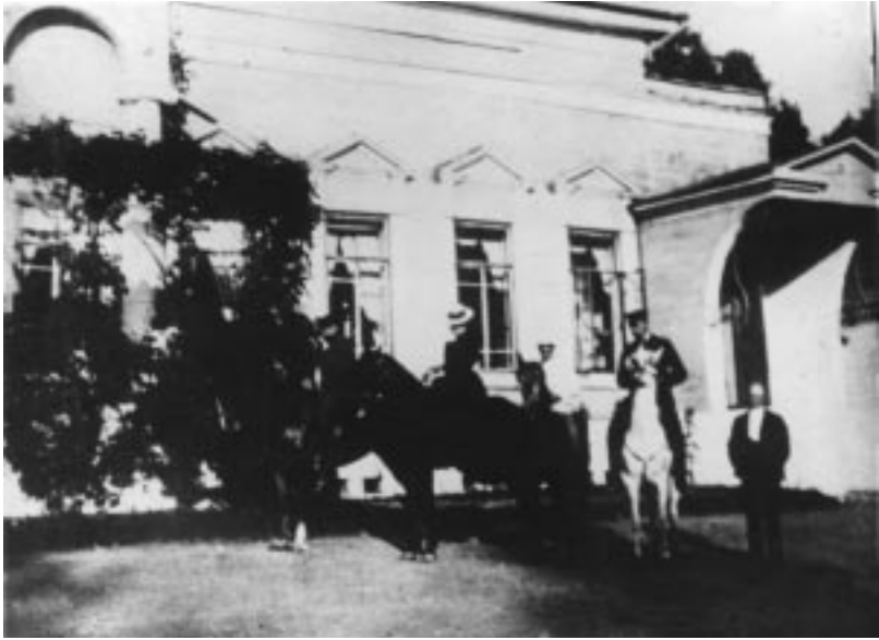
В усадьбе Беляницы