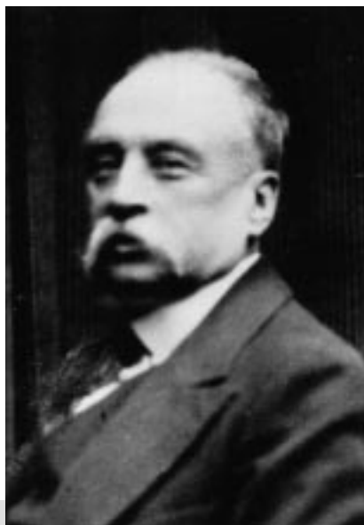
Григорий Вячеславович Глинка (1862–1934)